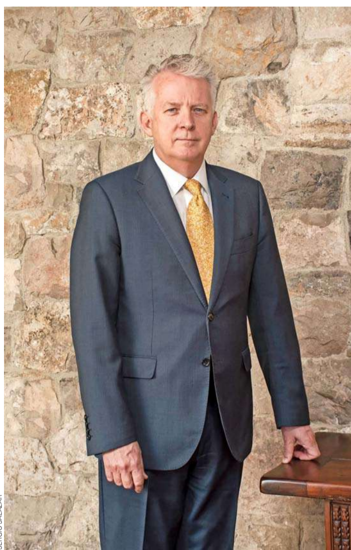
Todd Mercer, embajador de Australia

“Estas colaboraciones contribuyen a los esfuerzos globales por un futuro más sostenible. Por ello valoramos enormemente las inversiones de empresas australianas en Chile y de empresas chilenas en Australia, como lo son los casos de BHP,