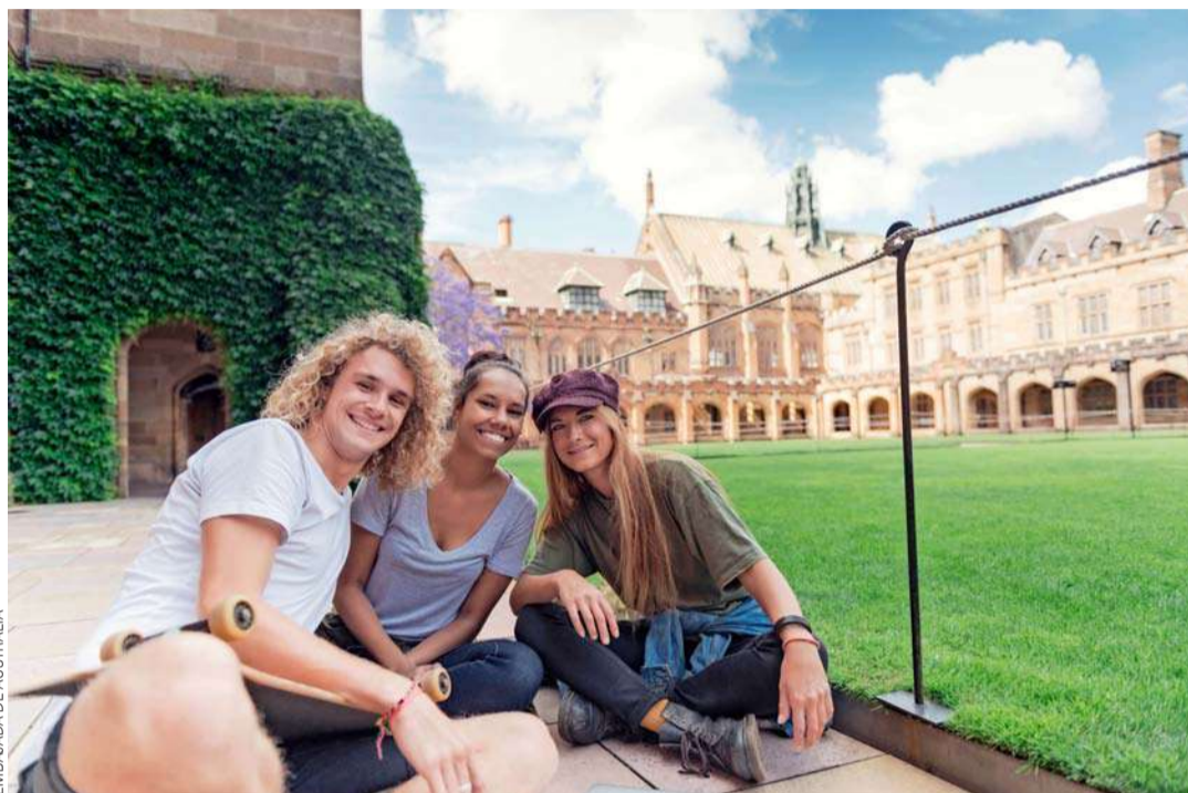
El 90% de las universidades australianas están entre las top 1.000 del mundo.

Por ejemplo, la nota exigida para el visado de estudiante