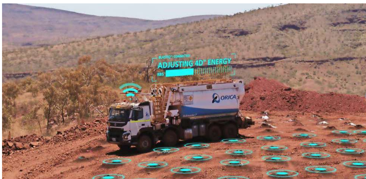
Tecnología 4D: La nueva tecnología en emulsión a granel de 4D™.

"Australia fue una gran experiencia tanto a nivel personal como profesional. En lo personal,