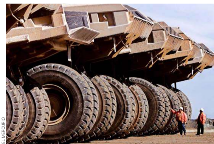
Los proyectos estrella de Auscham destacan en el sector minero.

Las similitudes entre los ecosistemas mineros chilenos y australianos, son la innovación y calidad de proveedores, esto ha permitido fortalecer aún más los lazos comerciales. La internacionalización a través de Pro Chile permite a las empresas chilenas puedan acceder a un estudio de mercado a bajo costo, respaldado por consultoras especializadas que evalúan su aptitud para la internacionalización, en caso que no califiquen, se les asesora para poder alcanzar la