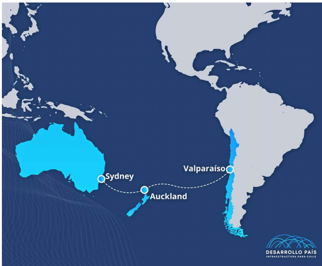
Este proyecto tendrá un modelo de negocios abierto y dará la posibilidad de que diversos públicos puedan adquirir parte de la capacidad de datos que se transmitan.