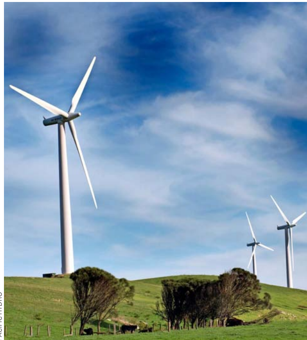
Desarrollar una industria del hidrógeno verde puede crear nuevos empleos, contribuir a combatir el cambio climático y fomentar un crecimiento económico más sostenible.

Las autoridades de Australia y Chile comparten esta visión. Según el biministro de Energía y Minería de Chile, Juan Carlos Jobet, con Australia, existen objetivos y desafíos, como la eficiencia energética y la generación en base a energías renovables. Además, los dos son los países con mayor potencial para la producción de hidrógeno verde.