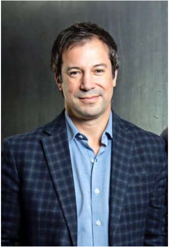
LUCAS PALACIOS, ministro de Economía, Fomento y Turismo.

Seis personalidades del mundo público y privado profundizan en la conveniencia de considerar la experiencia del país oceánico cuando se trata de avanzar en los desafíos que Chile tiene en distintos ámbitos.