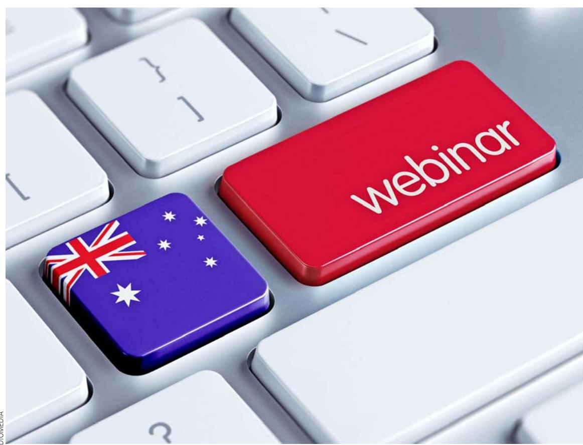
Treinta seminarios, con temas muy atinentes a cada momento, se realizaron en 2020.

La Cámara Chilena Australiana de Comercio no ha dejado por un momento de cumplir con su misión durante la pandemia. Solo en este tiempo ha realizado 30 webinars para que sus socios estén mejor preparados para enfrentar la contingencia y suscrito diversos convenios para propiciar un mayor intercambio de conocimiento con el país oceánico.